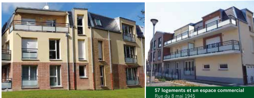
57 logements et un espace commercial Rue du 8 mai 1945

En tant que spécialistes de la promotion immobilière, et plus spécifiquement dans le domaine du secteur résidentiel conventionné, notre vocation est de contribuer à renforcer l'offre de logements en France, en partenariat avec les communes, les collectivités et les bailleurs sociaux.