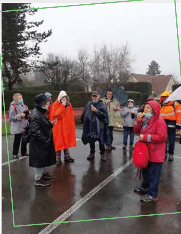
La volonté d'agir même sous la pluie d'hiver.

Nous avons innové en organisant une nouvelle activité : des marches-promenades pour parcourir les rues et les chemins de notre village. Il faut s'oxygéner et dérouiller nos articulations plutôt que de rester confinés, à tourner en rond chez nous ou assis devant le poste de télévision. Par tous les temps, 11 sorties agrémentées d'un ravitaillement à mi-chemin et d'un goûter à l'arrivée avec une boisson chaude ou froide en fonction de la température extérieure ont réuni plus de 260 personnes.